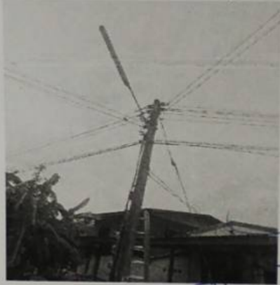
หลังซ่อมไฟหน้าบ้านนายบุญถม นามโสหมู่ที่ ๕