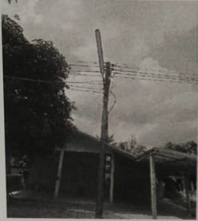
หลังซ่อมไฟหน้าบ้านนางลวด พันธุ์ลูกข้าวหมู่๕