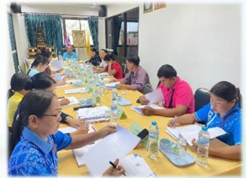
การประชุมคก.พัฒนา และประชุมประชาคมท้องถิ่น