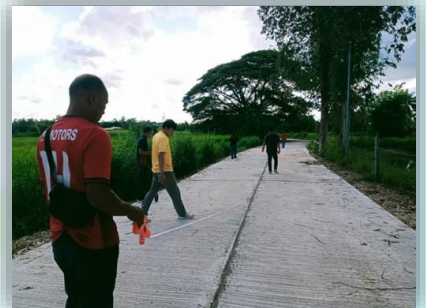
โครงการก่อสร้างถนนคอนกรีตเสริมเหล็ก หมู่ที่ ๗ เส้นสามแยกนางรันทา รัตนแสง