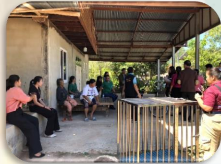
กิจกรรมการควบคุมโรคพิษสุนัขบ้า

ร่วมกับสำนักงานปศุสัตว์จังหวัด/ปศุสัตว์อำเภอ/หน่วยงานสาธารณสุข