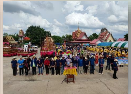
โครงการเรียนรู้ภูมิปัญญาท้องถิ่น สืบสานงานประเพณีบุญบั้งไฟ