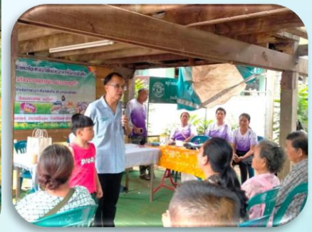
อุดหนุนหมู่บ้านตามโครงการพระราชดำริด้านสาธารณสุข