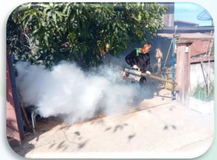
โครงการควบคุมและป้องกันโรคไข้เลือดออก