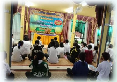
โครงการอบรมคุณธรรมและจริยธรรมเด็ก