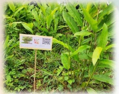
โครงการ ๑ อปท. ๑ สวนสมุนไพร