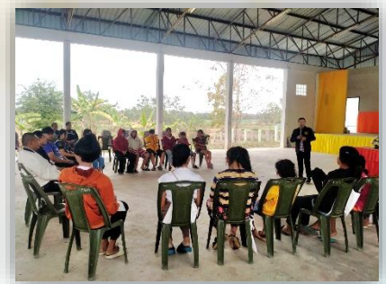
โครงการพัฒนาศักยภาพเด็กและเยาวชน ๒๕๖๗