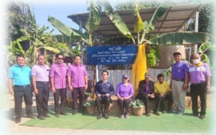
โครงการปลูกพืชผักสวนครัวและสมุนไพรในวัด ณ วัดสว่างแก้วนิมิตอุดมธรรม อ.ชื่นชม จ.มหาสารคาม