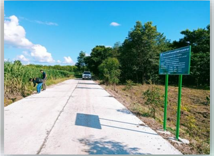
โครงการก่อสร้างถนนคอนกรีตเสริมเหล็ก หมู่ที่ ๓ เส้นจากบ้านนายทองยศ พิณโพธิ์ ถึงเขตติดต่อตำบลชื่นชม