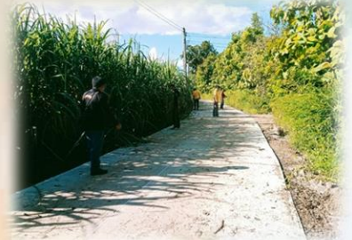
โครงการก่อสร้างถนนคอนกรีตเสริมเหล็ก หมู่ที่ ๒ จากที่นางสมพร นิลรัตน์คำ ถึงปายางนายพงษ์ไทย ดิอันกอง