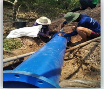
โครงการซ่อมแซมสถานีสูบน้ำและคลองส่งน้ำ หมู่ที่ ๔,๕