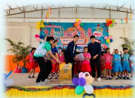
โครงการจัดกิจกรรมวันเด็กแห่งชาติ