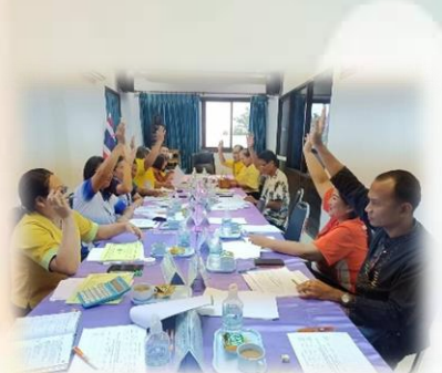
การประชุมคณะกรรมการกองทุนหลักประกันสุขภาพเทศบาลตำบลลาดุดก