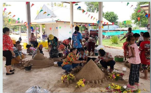
โครงการเรียนรู้ภูมิปัญญาท้องถิ่น สืบสานงานประเพณีสงกรานต์และลานวัฒนธรรม