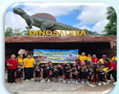
โครงการส่งเสริมการเรียนรู้ของเด็กในศูนย์พัฒนาเด็กเล็ก