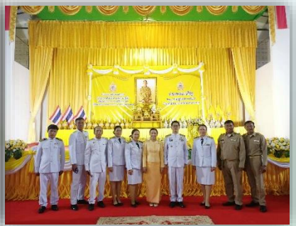
กิจกรรมตามโครงการปกป้องสถาบันสำคัญของชาติ