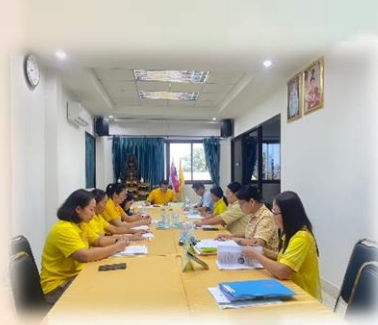
การประชุมคณะกรรมการสนับสนุนการจัดทำแผนพัฒนาเทศบาล