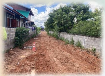
โครงการวางท่อระบายน้ำพร้อมบ่อพัก หมู่ที่ ๑๑