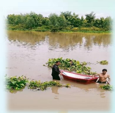
โครงการปรับปรุงภูมิทัศน์แหล่งน้ำสาธารณะ