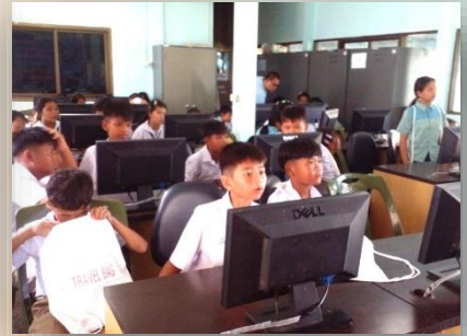
โครงการอบรมคอมพิวเตอร์เบื้องต้นสำหรับเยาวชน