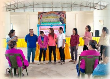
โครงการส่งเสริมบทบาทสตรีและสถาบันครอบครัว