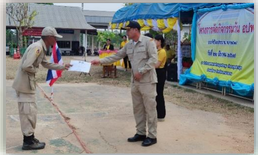
โครงการจัดงานวัน อปพร. ๒๒ มีนาคม ๒๕๖๗