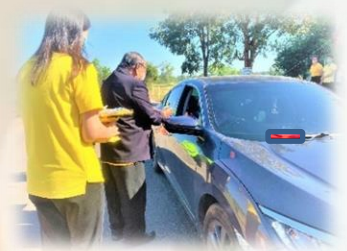
ตั้งจุดบริการประชาชนช่วงเทศกาลปีใหม่ พ.ศ.๒๕๖๗