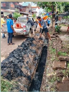
แก้ไขปัญหาร่องระบายน้ำอุดตัน