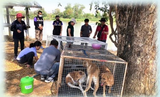
โครงการควบคุมและป้องกันโรคพิษสุนัขบ้า