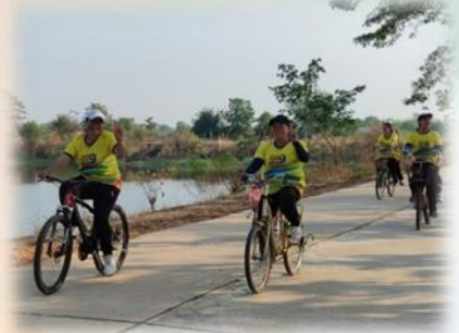
กิจกรรมส่งเสริมและพัฒนากายออกกำลังกาย และกีฬาเพื่อมวลชน ให้เป็นวิถีระดับตำบล กิจกรรม เดิน วิ่ง ปั่น ชมธรรมชาติ