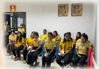
ประชุมผู้บริหารและพนักงาน