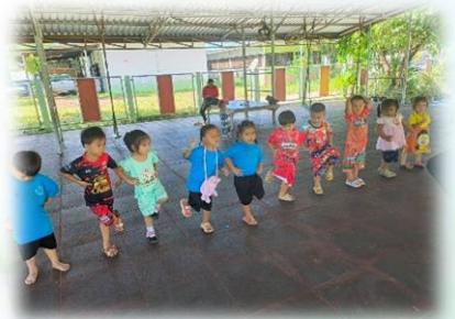
กิจกรรมการมีส่วนร่วมของผู้ปกครองศูนย์พัฒนาเด็กเล็ก