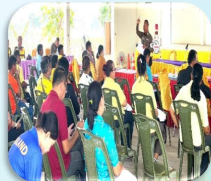
โครงการอบรมวินัยจราจร