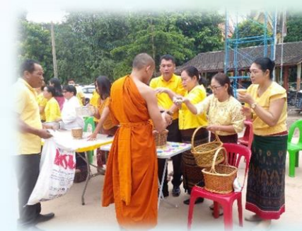
กิจกรรมทำบุญตักบาตรเนื่องในวันสำคัญ