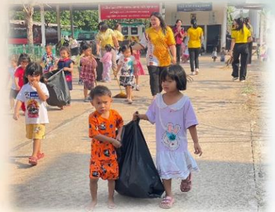
กิจกรรม Big Cleaning Day สำนักงาน/ที่สาธารณะ