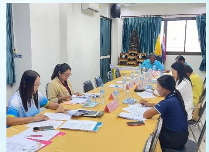
การประชุมคณะกรรมการติดตามและประเมินผลแผนพัฒนาเทศบาล