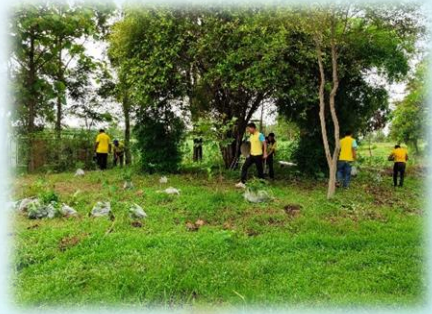
โครงการอบรมเยาวชนเกี่ยวกับการอนุรักษ์ทรัพยากรธรรมชาติและสิ่งแวดล้อม