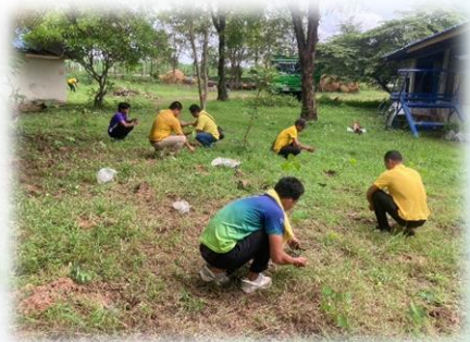
โครงการปลูกต้นไม้เพิ่มพื้นที่สีเขียว