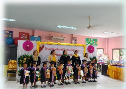
กิจกรรมประชุมผู้ปกครอง และกิจกรรมปัจฉิมนิเทศเด็กในศูนย์พัฒนาเด็กเล็ก