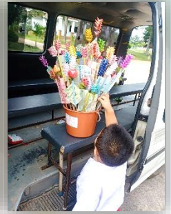
กิจกรรมทำบุญตักบาตรในสถานศึกษาของศูนย์พัฒนาเด็กเล็กเทศบาลตำบลลุดปลาตุ๊ก