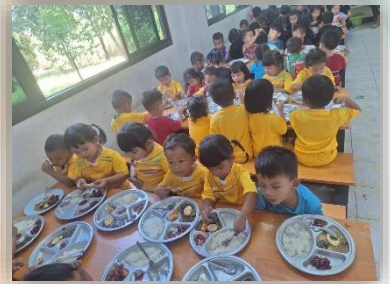
กิจกรรมอาหารเสริม (นม) อาหารกลางวันศูนย์พัฒนาเด็กเล็ก