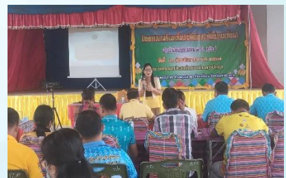
โครงการอบรมสัมมนาเพิ่มประสิทธิภาพการจัดทำแผนพัฒนาท้องถิ่น