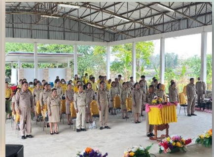
โครงการวันท้องถิ่นไทย