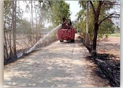
การระงับอัคคีภัย และช่วยเหลือสาธารณภัย