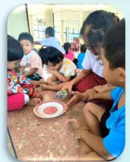
กิจกรรมทำบุญมหากรฐินของศูนย์พัฒนาเด็กเล็กเทศบาลตำบลลุดปลาตุ๊ก