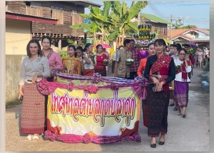
โครงการเรียนรู้ภูมิปัญญาท้องถิ่น สืบสานงานประเพณีลอยกระทง