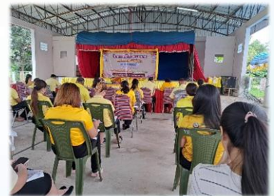
โครงการอบรมคุณธรรมและจริยธรรมสำหรับบุคลากร