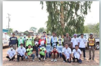
สนับสนุนการปฏิบัติงานของชุดปฏิบัติการหน่วยแพทย์ฉุกเฉินเทศบาลตำบลลาดุดก